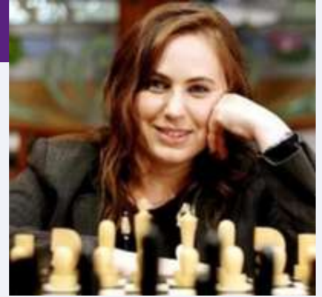
Judit Polgar (Budapest 23 de Juliol de 1976)

En el món dels escacs, un esport intel·lectualment desafiador i profundament estratègic, emergeix una figura que desafia les normes establertes i redefineix els límits del joc: Judit Polgár. Amb la seva ment aguda i la seva destresa en el tauler, Polgár ha deixat una marca indeleble en la història dels escacs, trencant barreres de gènere i desafiant les expectatives convencionals.